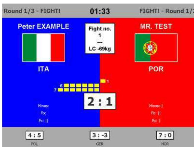
Ejemplo de la pantalla del Sistema Electrónico de Puntuación.